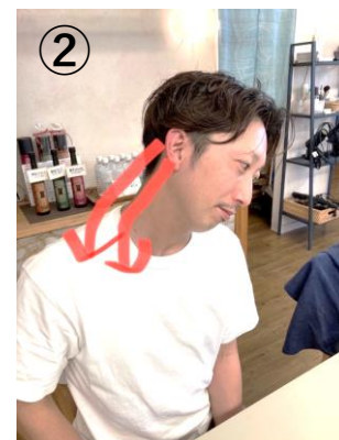
②同じ動きで、少しずつ後ろにずらしていく

首の血流アップで免疫力UPと五感全体を鍛えられる マッサージで、心と身体のバランスを整えてあげましょう。